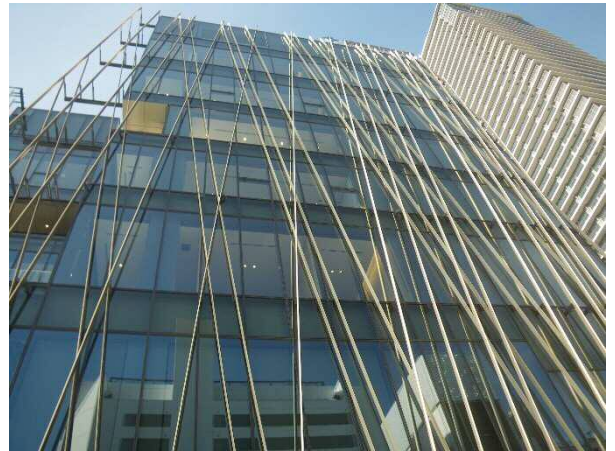
外壁上の木ルーバー（鋼板に木板を取り付け）