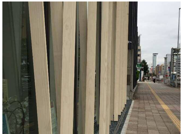
外壁上木ルーバー近景