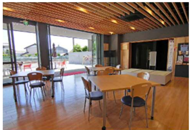
1階内観 備品設置後