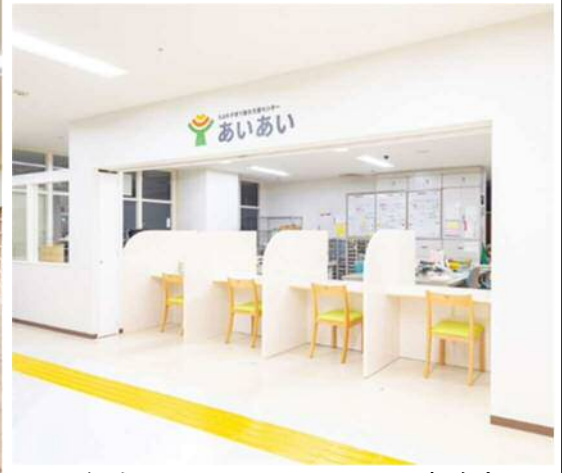
総合インフォメーション 事務室