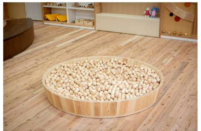
ひのきを使った木の玉プール