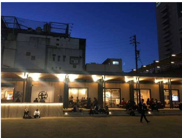
庇に採用した間接照明を点灯

多くの歩行者が行き交う駅前の場所（交差点付近）であることから、足を止め、施設へ寄りたくなるような仕掛けとして、庇を利用した間接照明を採用し、木材を生かしたデザインとなっており、また、施設利用者の日常に溶け込むように、木材の温もりや優しさを与えながらリラックスできる開放空間を生み出している。