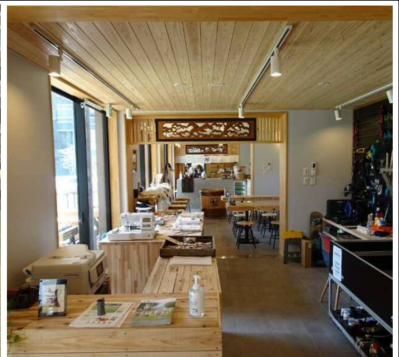
レーザー加工機を備えた工作室