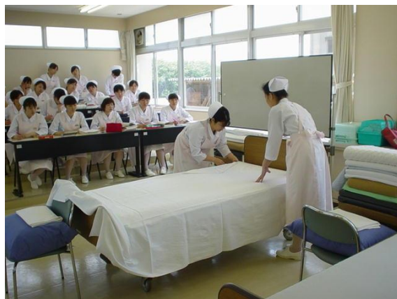
< 校内実習 >

看護師を目指す5年一貫教育を行う公立高校は、県内では桃陵高等学校、宝陵高等学校の2校です。