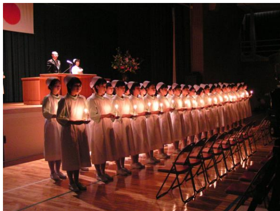
< 戴帽式 >