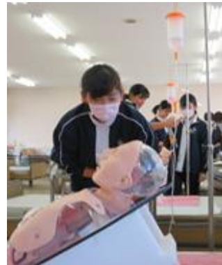
<医療的ケアの実習>

「社会福祉基礎」 「介護福祉基礎」 「コミュニケーション技術」 「生活支援技術」 「介護過程」 「介護総合実習」 「介護実習」 「こころとからだの理解」