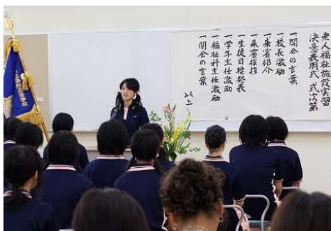
<施設実習決意表明式>