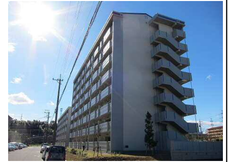
公営住宅等整備事業 整備イメージ