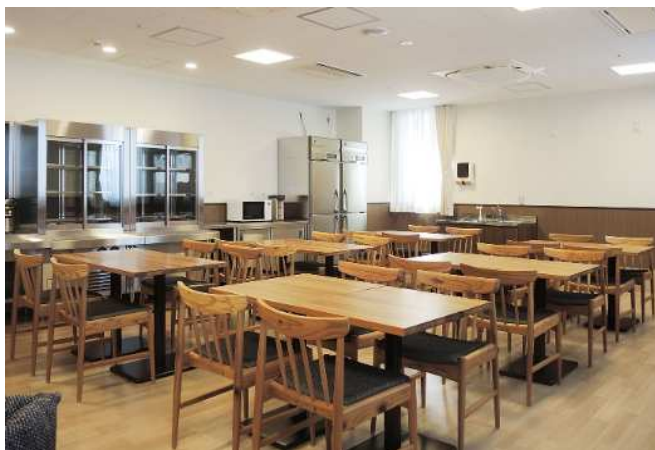
あいち認証材の机と椅子を設置した食堂

病院の新築に伴い、患者や家族の方が利用する食堂や相談室等に、あいち認証材の椅子やテーブルを設置し、地元の材に囲まれた癒しの空間を提供している。使用するスギ材は圧縮技術により強度を高め、不特定多数の方が使用する場所でも耐えうる仕様となっている。