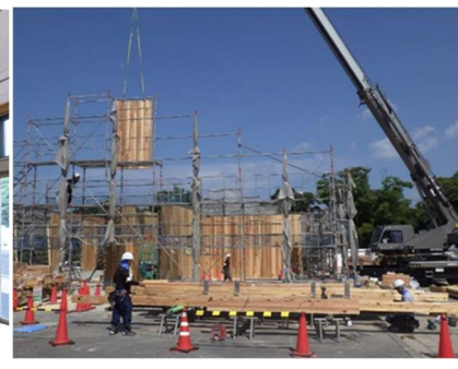
施工中 (CLT 建方状況)