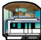
4ポイント賞 ピンバッジ 先着2,000名