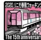
1日乗車券特典 アニバーサリーピンバッジ 先着500名

※配付予定数に達した場合、別デザインのピンバッジに替えさせていただきます。 あらかじめご了承ください。