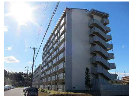
公営住宅等整備事業 整備イメージ