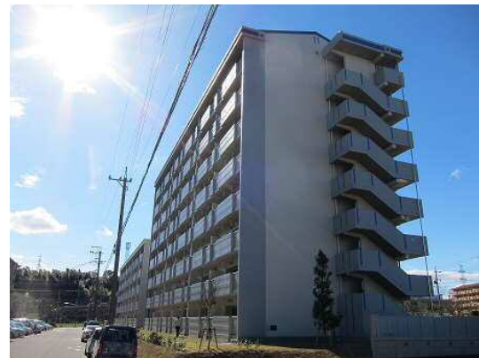
公営住宅等整備事業 整備イメージ