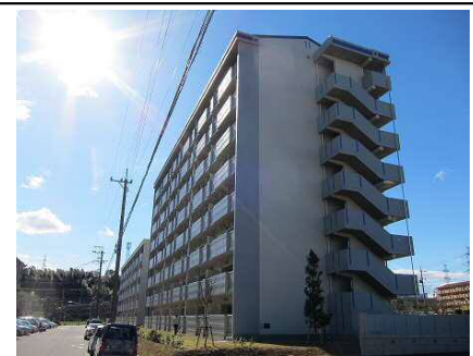
公営住宅等整備事業 整備イメージ

公営住宅等ストック総合改善事業 愛知県、岡崎市、春日井市、 豊川市、刈谷市、安城市、尾張旭市