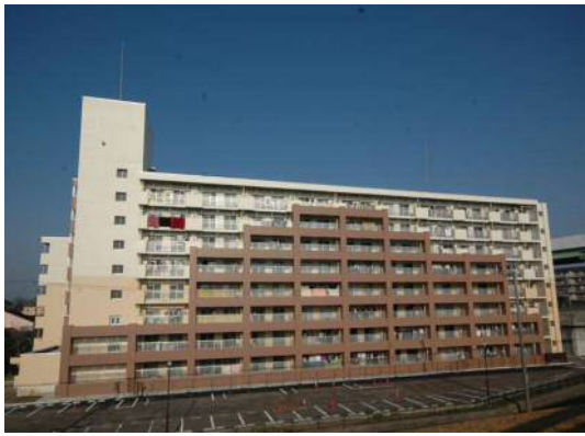
公営住宅等ストック総合改善事業 整備イメージ(耐震改修) 愛知県