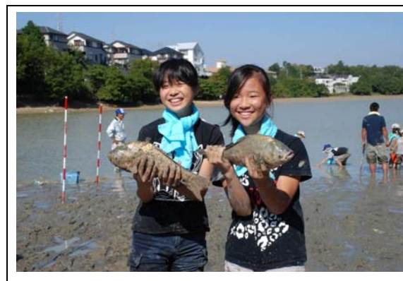
魚を捕まえました

当日は約200人の児童や保護者が参加され、水かさの減った池の中で、コイやフナなどの魚を捕まえました。捕まえた大型の魚は近隣の旭丘小学校のプールで保護され、工事終了後に池に戻されました。