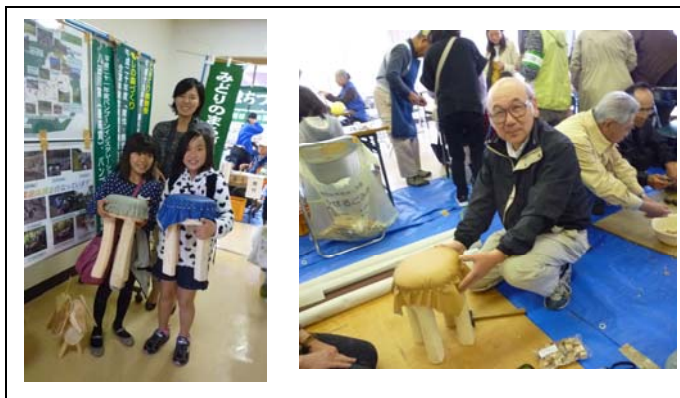
間伐材で椅子づくり

磨いた丸太に皮を張った椅子、自然な雰囲気が魅力のリースやハンギングバスケット、子どもたちの自由な発想が生きる竹や木の実工作、めずらしい杉玉づくり。各ブースとも大好評で、参加者は自然素材を使った作品づくりを通じて森の大切さを実感しました。