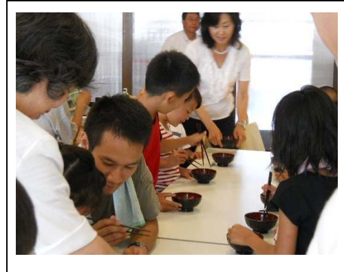
日進会場 大豆を使ったゲーム

日進市会場では、親子 9 組 32 名が、平成 24 年 8 月 4 日に「とにとクラブ」から大豆を使ったゲームで正しい箸の持ち方と使い方を学びました。