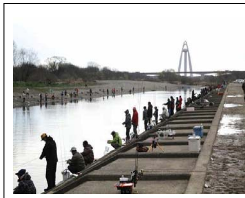
毎日大勢の人で賑わうます釣り体験場

(URL: http://kawaturitaikenjyou.on.omisenomikata.jp/ )