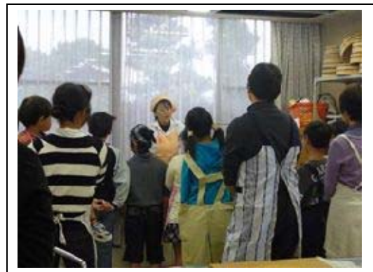
豊明会場 料理教室

東郷町会場では、平成 24 年 12 月 1 日に「東郷ヘルスパートナー」から紙芝居で自分たちが田植えをした稲がどうやって大きくなり稲刈りを迎えたかを学びました。