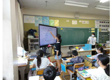
〈電子黒板で説明する児童〉

児童たちが活発に意見を出し合い、より多くの意見や情報に触れるためには、何でも話せる学級の雰囲気作りが大切である。ICTが深い学びに効果的であることは間違いないが、ICTに頼り過ぎず、ICTを手段の一つと考え、広い視野に立って授業を構成していくことを意識して、今後も研究を続けていきたい。