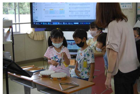
〈グループ活動する様子〉