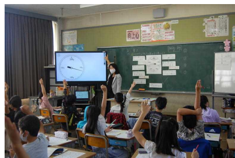
〈全体で話し合っている様子〉

振り返りでは、ワークシートに自分の頑張ったことを記号で示す部分と、自分の言葉で記述する欄を設けた。記号で示す欄では、スムーズに記入している児童が多かった。具体的に学習した内容を示したことで、児童は、自分の学びを実感することができた。低学年においては、身に付いたことを選択肢の中から選ぶだけでも十分振り返りとして有効ではないかと考えられる。