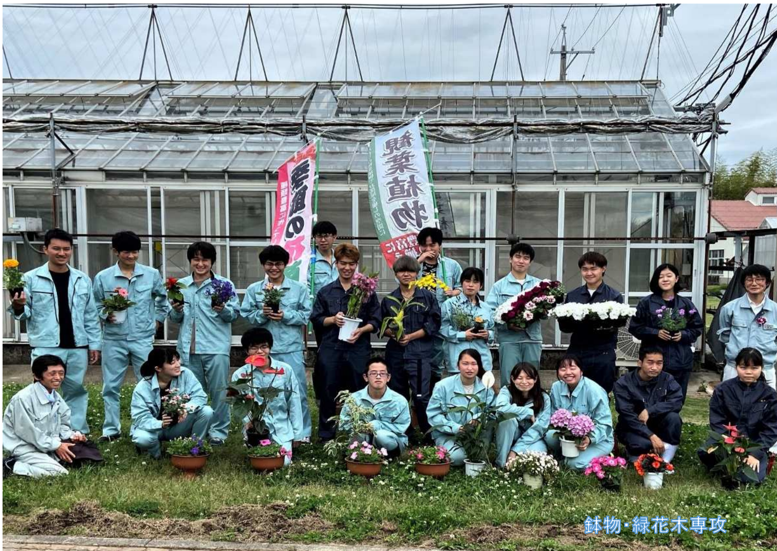
鉢物・緑花木専攻

ホームページ: https://www.pref.aichi.jp/soshiki/noudai/