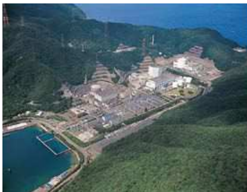
敦賀原子力発電所