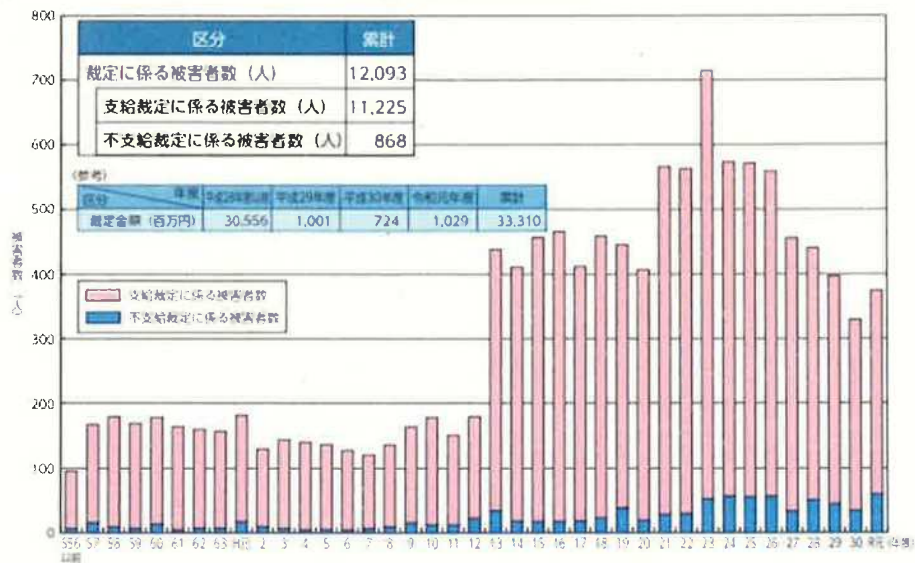
犯罪被害給付制度の運用状況