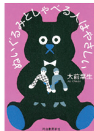
『ぬいぐるみとしゃべる人はやさしい』 大前 衆生 著 河出書房新社