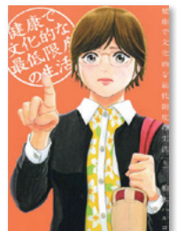
『健康で文化的な最低限度の生活⑧⑨』 柏木 ハルコ 著 小学館

映像資料・図書リストについては、ホームページでもご覧いただけます。 https://www.pref.aichi.jp/soshiki/jinken/0000085097.html