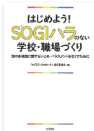
『はじめよう! SOGIハラのない学校・職場づくり』 「なくそうSOGIハラ」実行委員会 編 大月書店