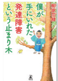
『僕が手に入れた発達障害という止まり木』 柳家 花緑 著 幻冬舎