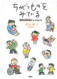
『ちがうものをみている ～特別支援学級のこどもたち』 のえみ 著 石風社