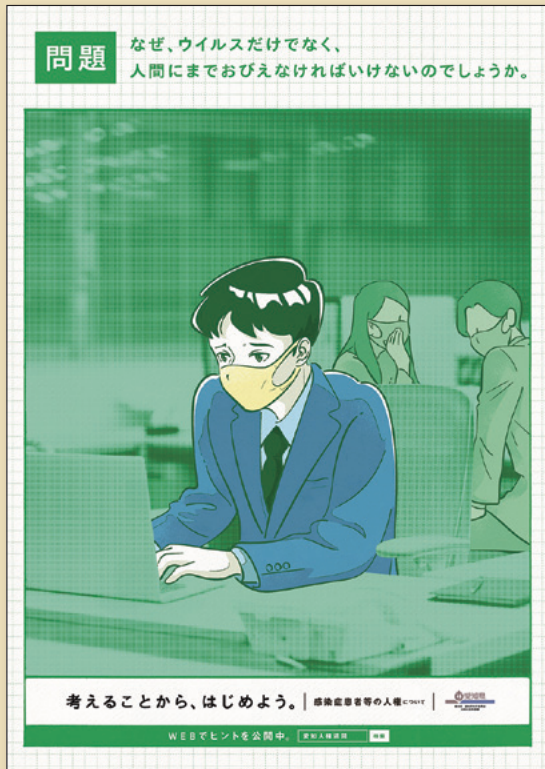
2020年度人権啓発ポスター ～感染症患者等の人権～

今、世界中で猛威を振るう新型コロナウイルス感染症。感染拡大に伴い、感染者やその家族、医療従事者等に対する差別や誹謗中傷、いじめが大きな社会問題となっています。