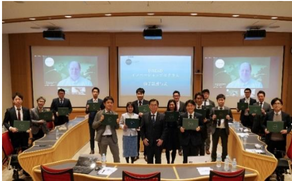
INSEAD イノベーションプログラム 成果報告会 (2021年3月26日)

県内の大学関係者を対象に、IMT Atlantique や同グループの学校が実施する大学発スタートアップへの支援についての知見を習得するとともに、同校と参加者が今後、人材・学術面での交流を進めるためのネットワークの構築を目的とした交流セミナーを実施。