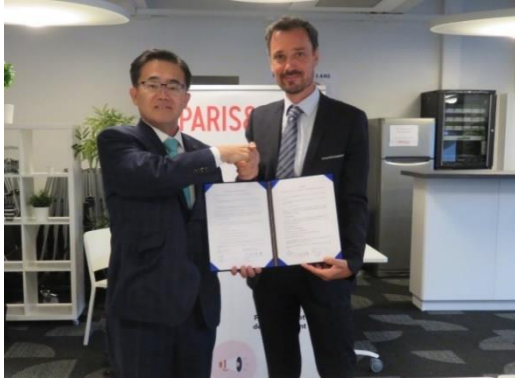
Paris&Co との MOU 締結式の様子 (2019年8月23日)