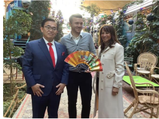
大村知事による Station F 訪問 (2020年1月22日)