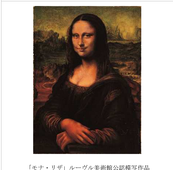
「モナ・リザ」ルーヴル美術館公認模写作品