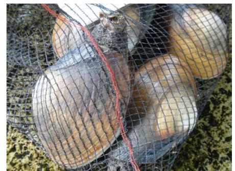
漁獲されたミルクイ