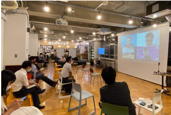
中国市場理解連続セミナーの様子 (2020年7月)

愛知県内企業と中国スタートアップのビジネスマッチングプログラムを実施。具体的には、TUS ホールディングスが選定した AI・IoT、ロボット・スマートデバイス・新素材、環境・エネルギーの分野で最先端のテクノロジーを有する中国スタートアップ 14 社と、愛知県内の企業とのマッチングを目的としたピッチイベントをオンラインで開催。