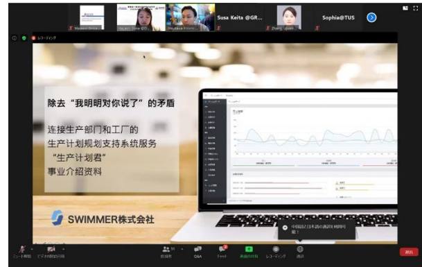
県内スタートアップ支援プログラム ピッチイベントの様子 (2021年1月)