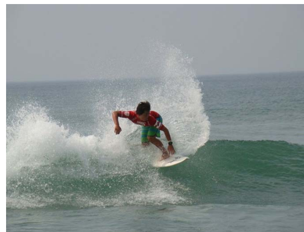
田原サーフィン世界大会