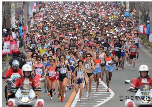
名古屋ウィメンズマラソン