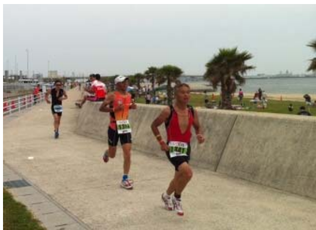
常滑・知多アイアンマンレース