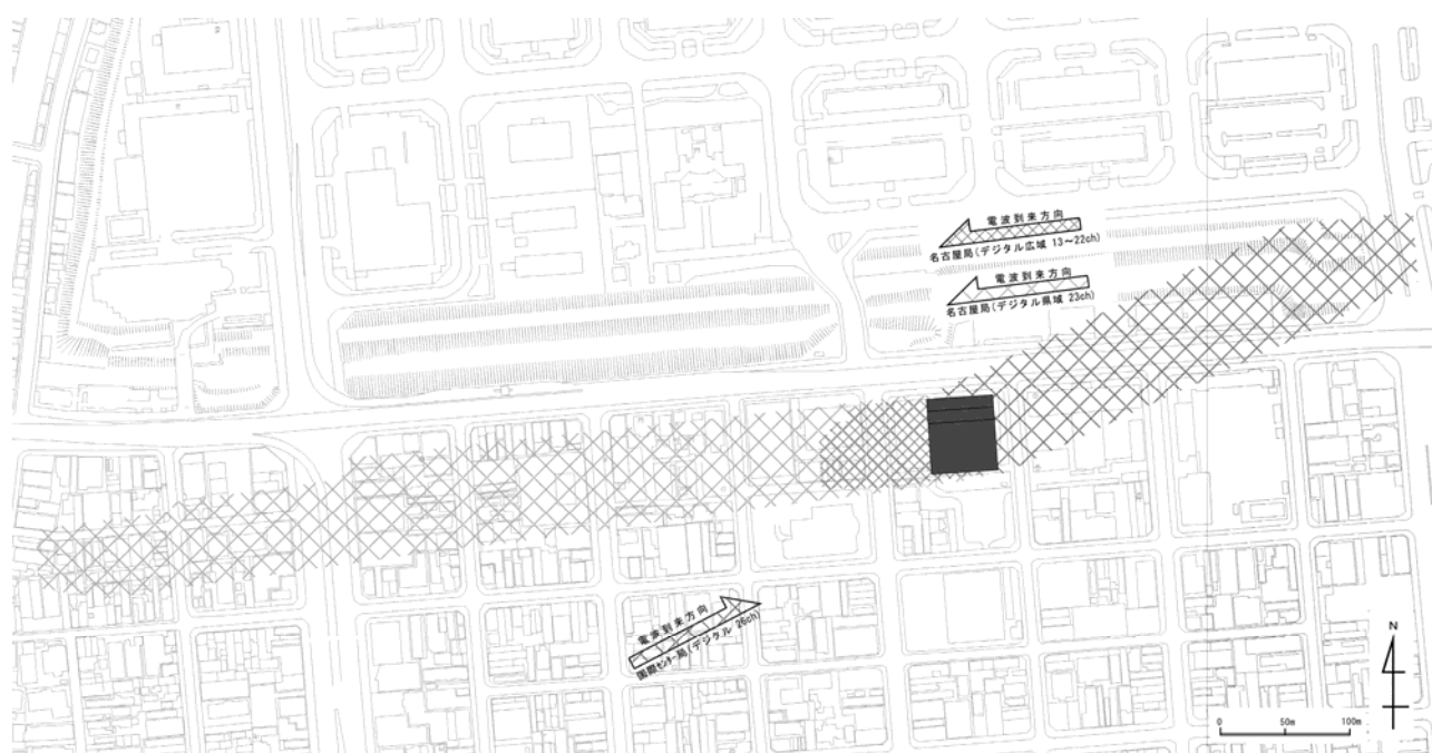
計画配置と予測結果（変電施設）

今後は事前の確認を行うとともに、事業実施後に障害が発生したと判断された場合は、有線テレビジョン放送の活用等の環境保全措置を講じてまいります。