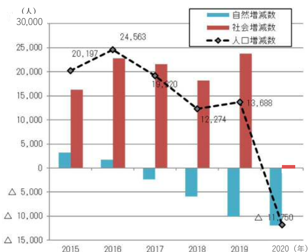
＜本県人口増減数の推移＞