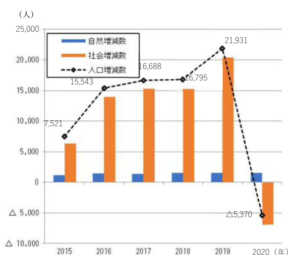
＜本県人口増減数の推移（外国人）＞