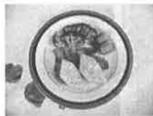
ポークステーキハワイアン