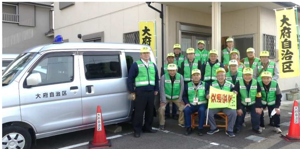
令和3年度 大府自治区青色回転灯パトロール隊当番表 《令和3年10月～令和4年3月》

大府自治区では、30名の青パト隊員が、毎月8回（火・木）及び防犯の日（毎月15日頃）に、自治区内を区車にて青色パトロールを実施しています。