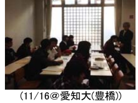
豊橋創造大学 見目教授 企業経営とエネルギー・環境問題