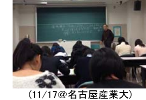
愛知学院大学 竹市客員教授 「学び」について