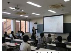
名城大学 林准教授 ソーセージとチーズの科学