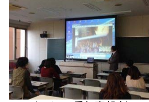
日本福祉大学 影戸教授 あなたが世界に何ができるのか