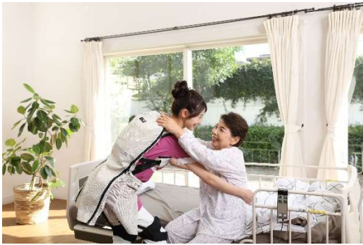
①パワーアシストスーツ J-PAS fleairy(フレアリー)

※1、2 パワーアシストスーツ J-PAS fleairy(フレアリー)／自立推進トレーニング 味 ット J-Walker テクテックの概要 開発企業：株式会社ジェイテクト