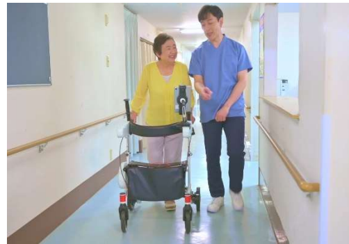
②自立推進トレーニング 味 ット J-Walker テクテック

①J-PAS fleairy(フレアリー)は、介護作業の「あったらイイナ」を実現するため、さまざまな皆様のお声を頂いて開発を進めた商品で、装着者の動きに応じてアシストする「アクティブパワーアシストスーツ」です。衣服のような着心地で動きやすく、長時間でも快適な介護作業を実現し、装着者様の腰の負担を軽減。ロボット感をなくすことで利用者様も安心の優しいデザインを採用しました。軽量コンパクトで、介護する人・介護される人に優しく、作業しやすく、着脱しやすいパワーアシストスーツとなっております。