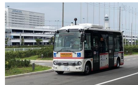
自動運転実証実験(中部国際空港島)