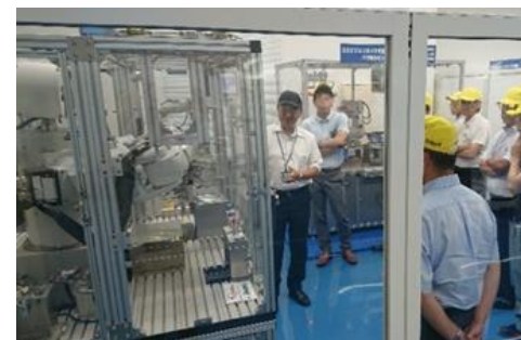
製造現場のデジタル化支援