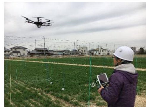
ドローンでの観測による小麦の生育調査