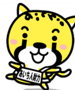
あいち人財力強化プロジェクト イメージキャラクター「アイチータ」