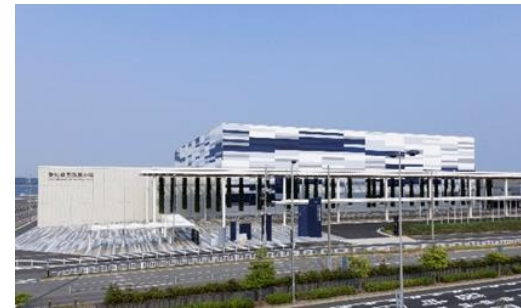
愛知県国際展示場 (Aichi Sky Expo)