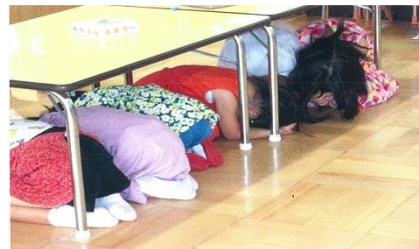
↑安城市立えのきこども園でのシェイクアウトの様子 (2021年)