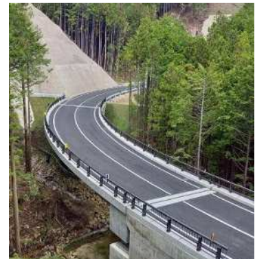
奥三河2期地区で整備した農道橋