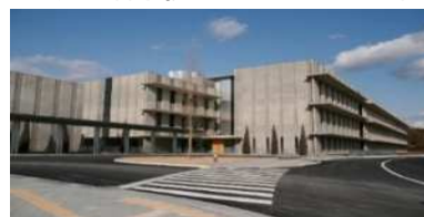
あいち産業科学技術総合センター 本部