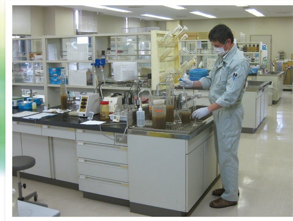
流入水・放流水等の状況を厳しく検査します。