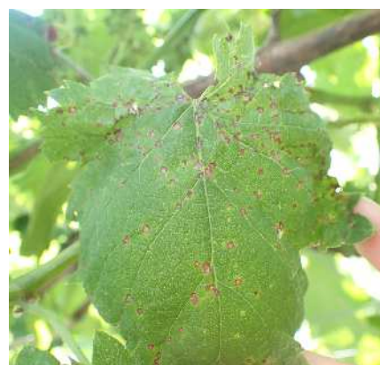
図2 ブドウ黒とう病発病葉