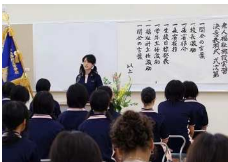
< 施設実習決意表明式 >