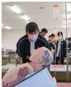
< 医療的ケアの実習 >

「社会福祉基礎」 「介護福祉基礎」 「コミュニケーション技術」 「生活支援技術」 「介護過程」 「介護総合実習」 「介護実習」 「こころとからだの理解」