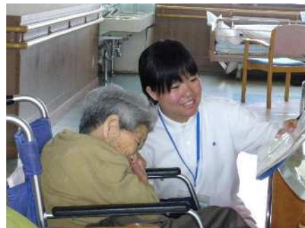
< 施設実習 >