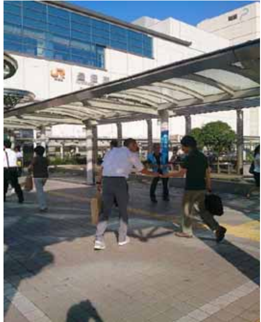
街頭での配布状況