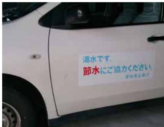
公用車ステッカー