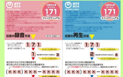
災害用伝言ダイヤル（171）クリックマニュアル

大勢が一斉に電話しようすると、回線が混み合っつながりにくくなることがありますので、安否確認には災害用伝言ダイヤルや災害用伝言板サービスを活用しましょう。