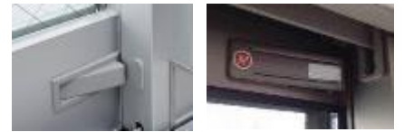
住宅等の防犯部品