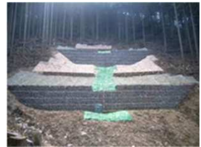
山腹崩壊地の復旧状況

また、保安林の公益的機能の発揮のため、森林の適正な保育（本数調整伐）工事を40ha実施しました。