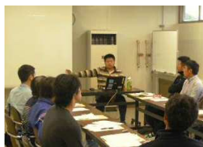
新規就農者向け講習会

新規就農者の定着・支援のため、経営が不安定な就農直後の岡崎市始め7市町の新規青年就農者25名に対する青年就農給付金（経営開始型）の給付を支援しました。