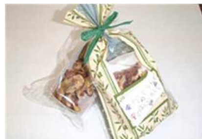
商品化したドライイチジク

農政課では、生産者と企業の意見交換、試作品の確認、パッケージのアイデア交換などを通じて支援してきましたが、名古屋に本社を置く「ポッカサッポロフード&ビバレッジ㈱」から新商品として、西尾の抹茶を用いた自動販売機向け缶飲料「抹茶ラテ」の販売が開始されました。