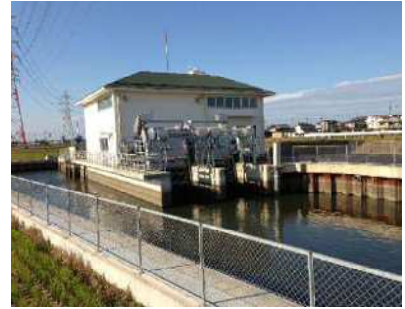
たん水防除事業北浜南部1期地区 (西尾市 行用排水機場)

たん水防除事業により西尾市の3地区（北浜南部1期地区、藤江地区、荻原地区）等で排水機場の整備を実施しました。また、海岸整備事業等により碧南海岸、吉田海岸、西尾海岸の堤防や樋門の整備を行いました。