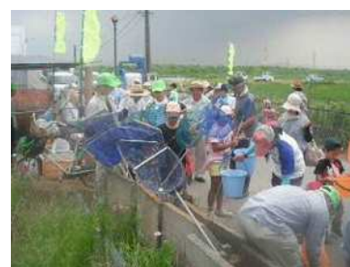
ジャンボタニシ撲滅大作戦

この事業に取り組んでいる「北浦鷺塚保全会（碧南市）」では外来種の駆除活動として、「ジャンボタニシ撲滅大作戦」を実施しました。ジャンボタニシの駆除に併せ、ジャンボタニシの生態の紹介や、駆除したジャンボタニシの大きさの競い合いといった地域の子ども向けのイベントを開催する等、環境に配慮した活動を行っており、このような生物多様性や農村景観の保全活動を支援しました。