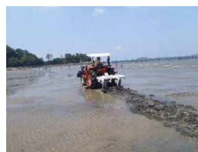
底質改良のための耕うん

干潟・藻場を保全するための活動組織である「幡豆地区干潟・藻場を保全する会」が実施した干潟の底質改良のため、トラクターによる耕うん、アマモ場を回復するための種子採取、選別、播種等の保全活動を指導・支援しました。