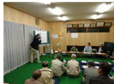
森林経営計画制度の地元説明

また、森林施業の集約化を図るため、森林経営計画制度の説明会を岡崎市の2地区で開催し、森林経営計画の作成指導を図りました。