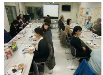
地元産給食の試食