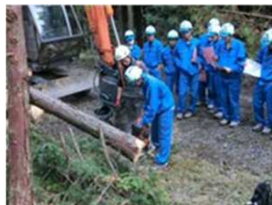
高校生の現場体験

また、林業への新規就労促進のため、農林高校生が森林組合の作業現場を見学・体験できるように支援をしました。