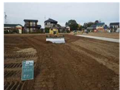
ほ場の整地状況（岡崎市 東牧内地区）

経営体育成基盤整備事業により東牧内地区（岡崎市）及び高棚地区（安城市）、農村活性化住環境整備事業により深池地区（西尾市）では、ほ場整備、排水対策特別事業により深池地区（西尾市）では、排水路、排水機場の整備を実施しました。