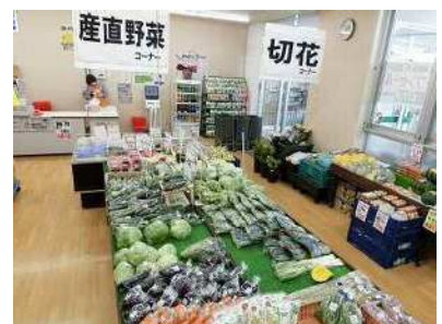
農産物直売所（岡崎市 はいらっせぬかた）

また、同じく額田地域において、地域の特性を生かした棚田の保全や農業体験に取り組む「じさんじよの会」と、ホテル祭りや山登りイベントを行う「鳥川ホテル保全会」の活動に組織の指導員とともに取り組み、中山間地域の活性化を図りました。