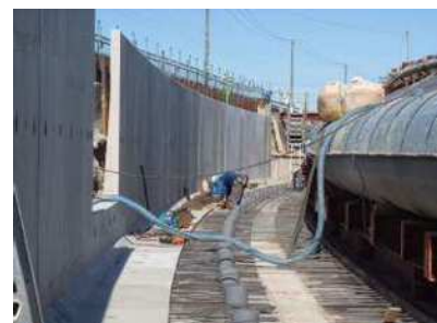
水路工事状況（刈谷市 中井筋依佐美地区）

かんがい排水事業により中井筋地区及び中井筋依佐美地区（刈谷市）では排水路、村高地区（岡崎市）では用水路、水路水質保全対策事業により吉田1期地区（西尾市）では排水路、農業水利施設保全対策事業により吉良地区（西尾市）では揚水機場の整備を実施しました。