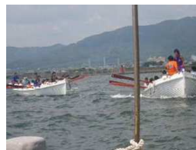
カッター漕艇訓練（少年水産教室）

三河地区漁業地域の中学生を対象に平成26年7月29日に開催された「少年水産教室」の参加者募集と同教室運営に積極的に協力しました。