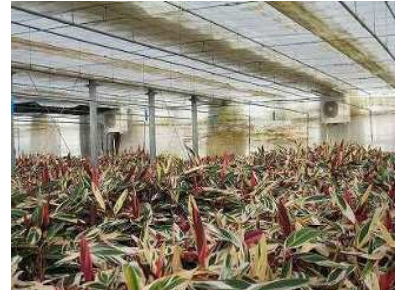
ヒートポンプの利用状況

鉢物農家等に導入されたヒートポンプや木質バイオマス利用加温設備（薪ボイラー）について、効率的な利用技術を行うため、それぞれ利用実態や経済性を調査し、利用技術をマニュアル化して、研修会を開催しました。