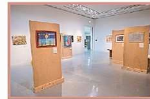
2021年9月「あいちアール・ブリュット美術館」