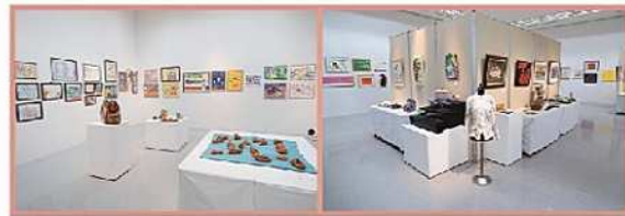
2021年9月「あいちアール・ブリュット展 公募作品展」

過去のあいちアール・ブリュット展で、2回入選された方、アート雇用で活躍されている方の作品を中心に特別展示をご紹介します。