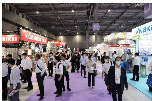
FOOMA JAPAN 2021 【写真】