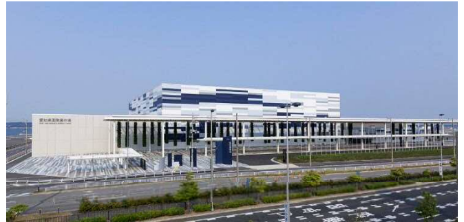
Aichi Sky Expo

愛知県は、製造業を中心とした世界有数の産業集積があり、国際空港や高規格道路網等充実した交通インフラを有しています。Aichi Sky Expo（愛知県国際展示場）は、こうした愛知県の特性を活かし、展示会等を通じた多様な交流の促進等による新産業の創出や既存産業の強化等を図っています。また、国内外からの集客による産業首都愛知の新たな交流・イノベーション拠点の創造に寄与していきます。