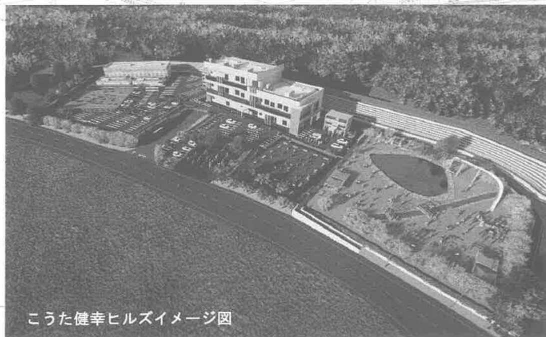
こうた健幸ヒルズイメージ図