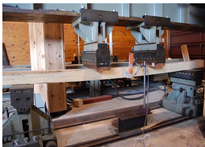
連携協定に基づき相互利用している試験研究機器（実大強度試験機）