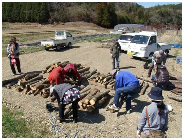
イベント（しいたけ菌打ち：3月23日）