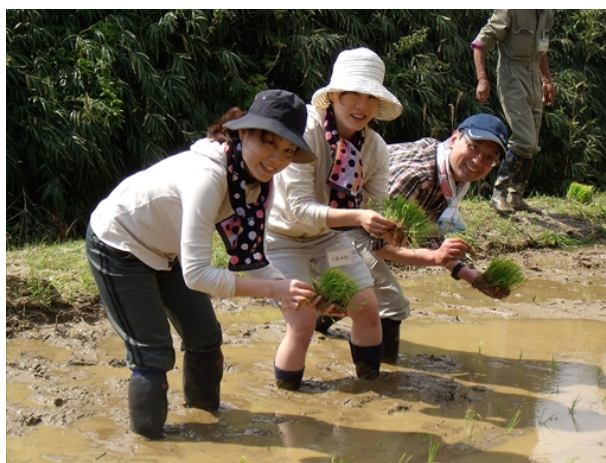
イベント（田植え：5月5日）