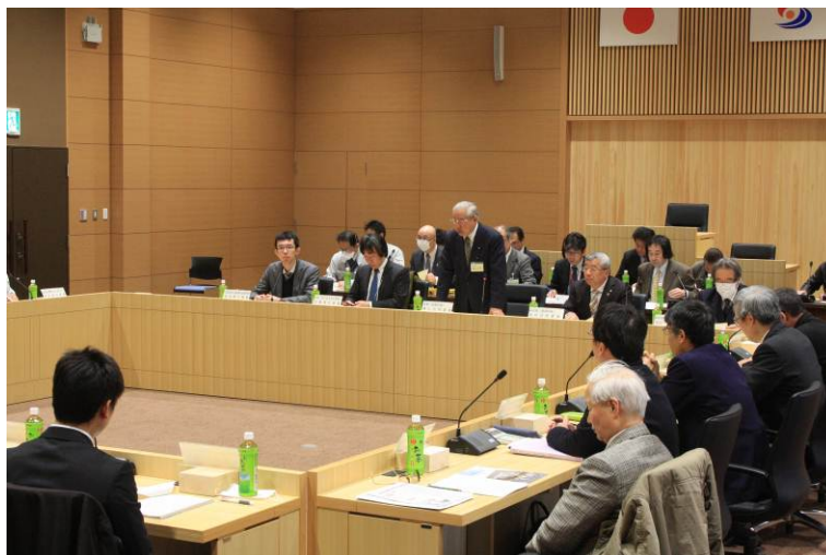
北設楽郡公共交通活性化協議会（設楽町）