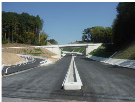
国道151号新城バイパス