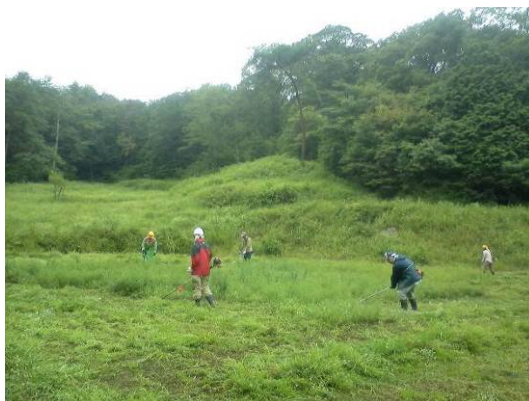
「三河の山里 - 集落応援隊」活動