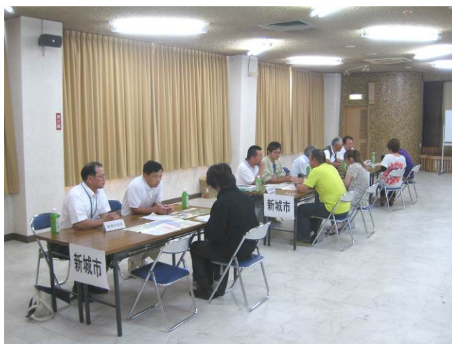
就農相談会（新城市：10月12日）