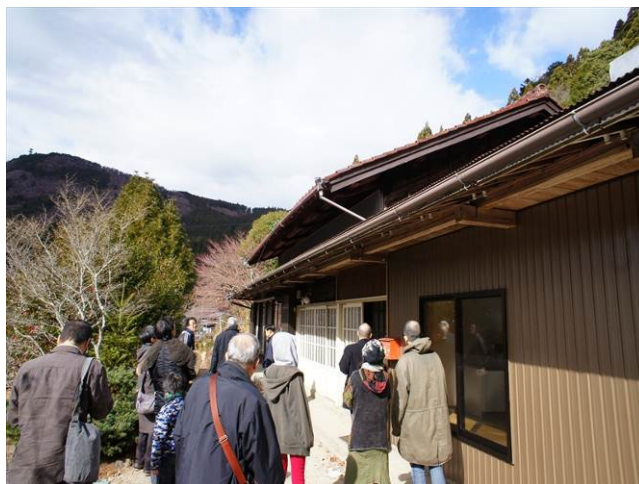
空き家リフォーム住宅見学会（東栄町：12月8日）