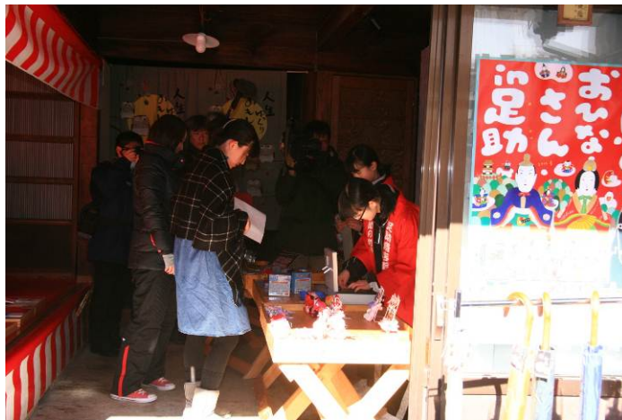
足助中央商店街「中馬なごやか市」(7月21日)