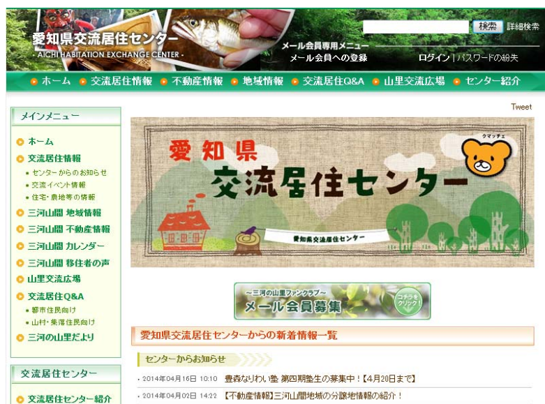
愛知県交流居住センターのホームページ