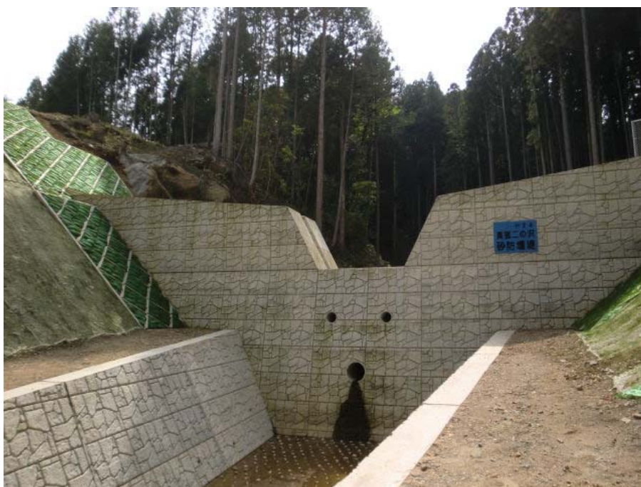
新たに整備された堰堤（豊川水系：新城市連合地区）