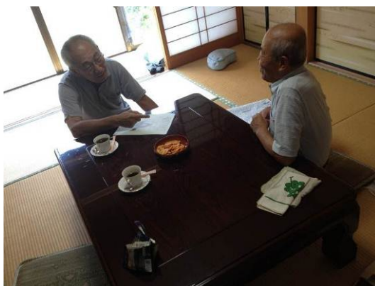
小規模高齢化集落アンケートの様子(9月～11月)