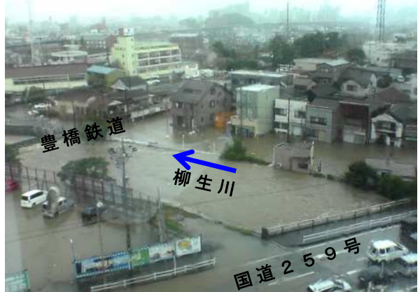
地下河川の整備効果