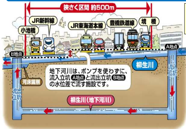
2008年8月末豪雨による浸水被害の軽減 (床上浸水の解消)