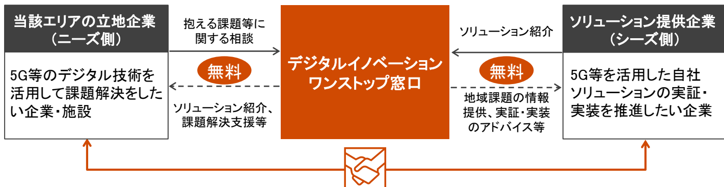
図1: 窓口の位置づけ

ニーズ側・シーズ側の要望に応じて、企業等同士のマッチングを推進 (マッチング後の実証・実装に向けたロードマップ策定等の計画策定支援も実施)