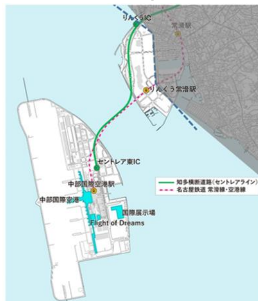
図2: 中部国際空港島及び周辺地域

また通信事業者等と愛知県は、5G提供エリアの早期拡大等に関する協定を締結しており、5Gを活用した事業・サービスの加速化に向けた環境が整いつつある魅力的な地域となっています。