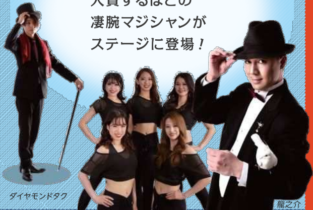
ダイヤモンドタク