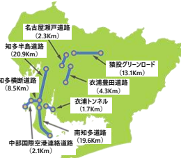
【資料】愛知県国家戦略特別地域HP 有料道路コンセッション (URL: 下記)