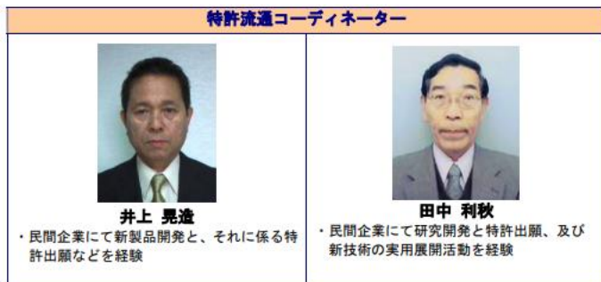
【資料】愛知県「愛知県知的所有センターパンフレット」